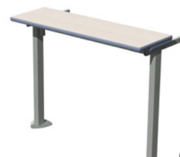
Table filante rabattable PMR