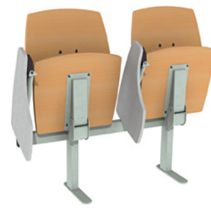
Siège poutre 2 places N350 avec tablette écrivain