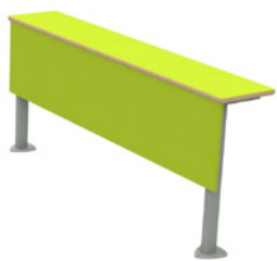
Table filante 1er rang pour sièges 320 & 330