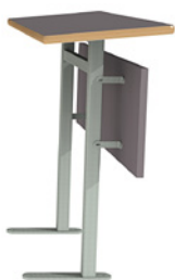
Table filante pour siège N350