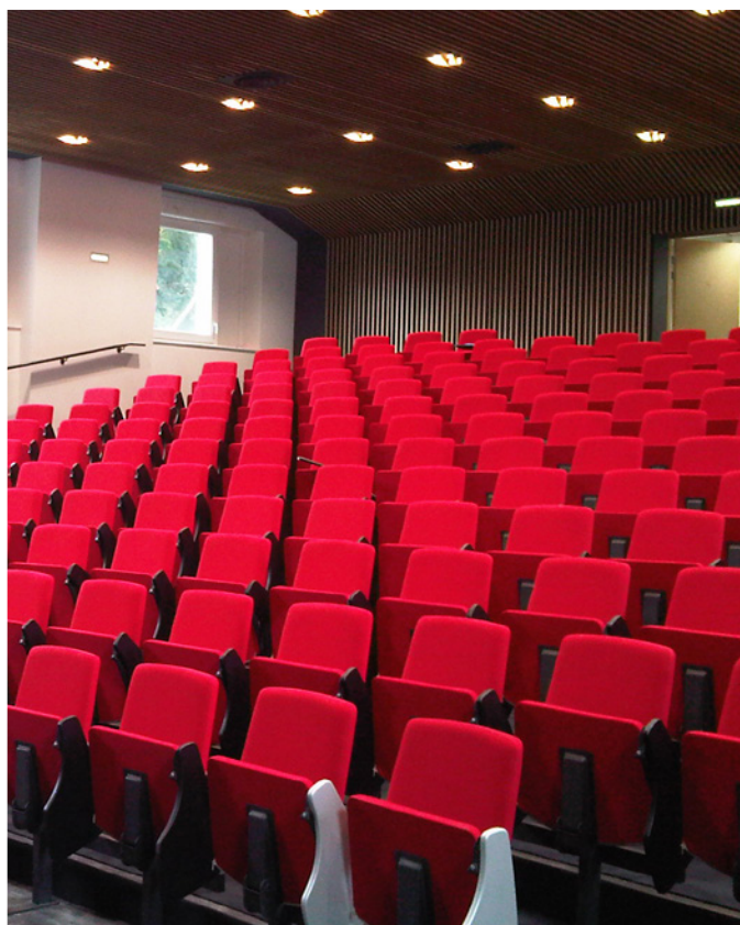
Siège ARENIS 350 Assise et dossier garnis, dossier et finition Confort. Auditorium lycée Ozanam, Chalons-en-Champagne (51)