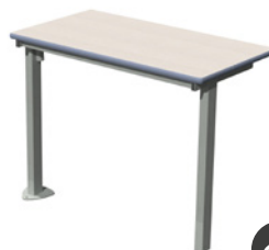
Table filante pivotante PMR