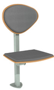
Siège 320 forme A2 avec placet tissu