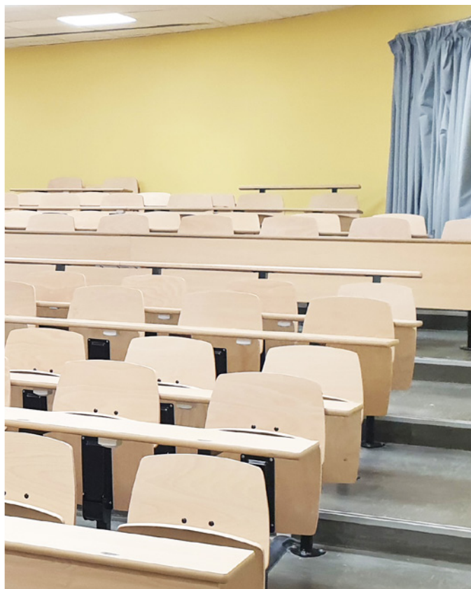
Siège ARENIS 330 Assise et dossier en bois, dossier forme A1. Amphithéâtre, Calais (62)