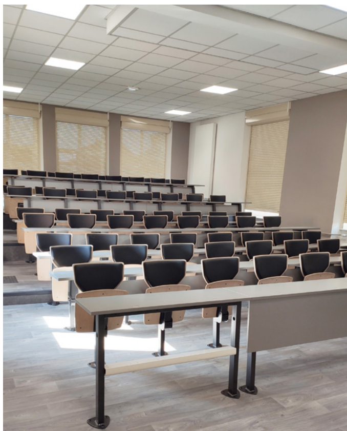
Siège ARENIS 330 Assise et dossier avec placet tissu, dossier forme A3. Amphithéâtre IUT Moselle EST (57)